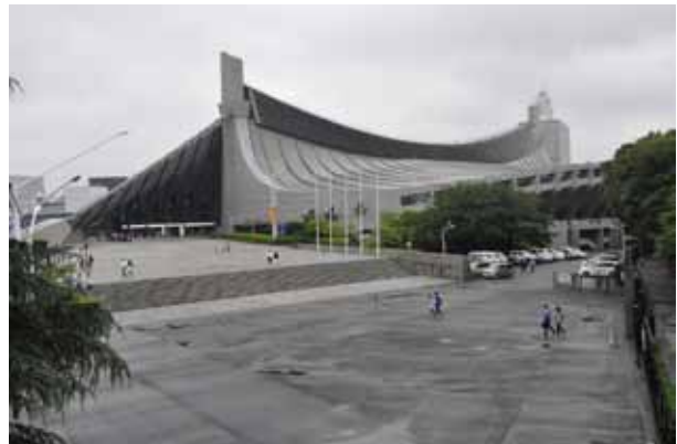
Kenzo Tange, Estadio Olímpico, Tokio.

Variaciones de este hormigón son los de polvo reactivo, que son hormigones de ultra alta resistencia y alta ductilidad con propiedades mecánicas de avanzada, no contienen agregado grueso, se hacen esencialmente de finos (polvos) y su microestructura