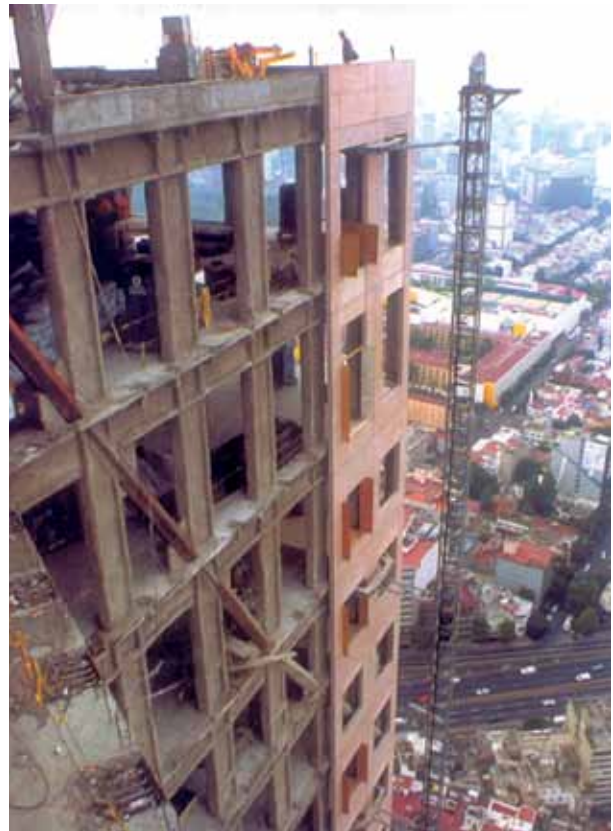
Torre Mayor, México, montaje de fachada premoldeada. Revista Construcción y Tecnología.