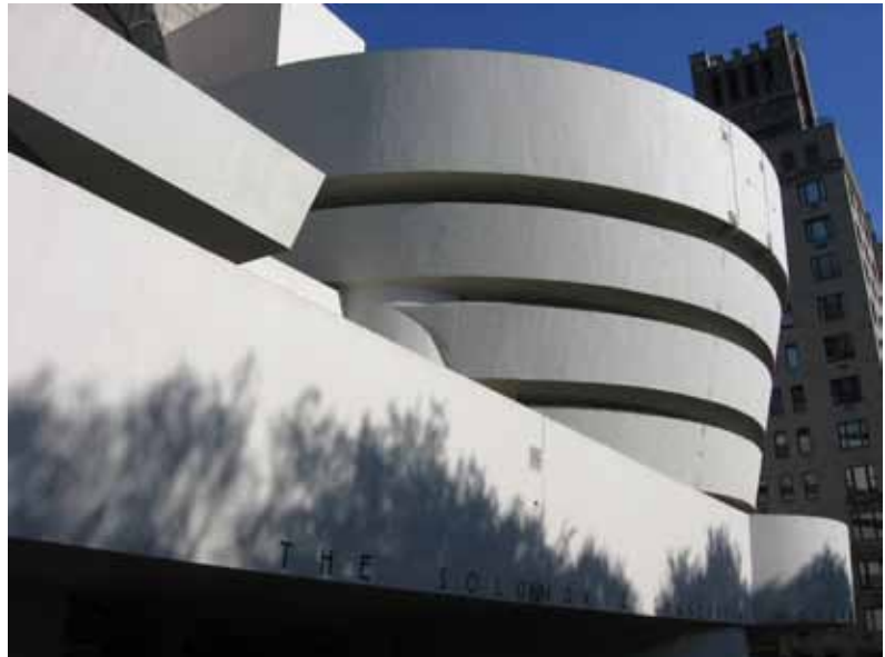
Museo Guggenheim, New York, Frank Lloyd Wright.

protagonista de obras de hormigón visto. En el tema de los agregados, la industria avanza en sus investigaciones para el empleo novedoso de materiales; por ejemplo una empresa canadiense ha introducido al mercado del hormigón decorativo agregados finos y gruesos hechos de una mezcla de material foto luminiscente con resina sintética, con un ciclo de vida de luminiscencia de 15 años. Durante el día el material tiene un tono amarillo