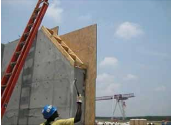
Encofrados de madera Sharcote.