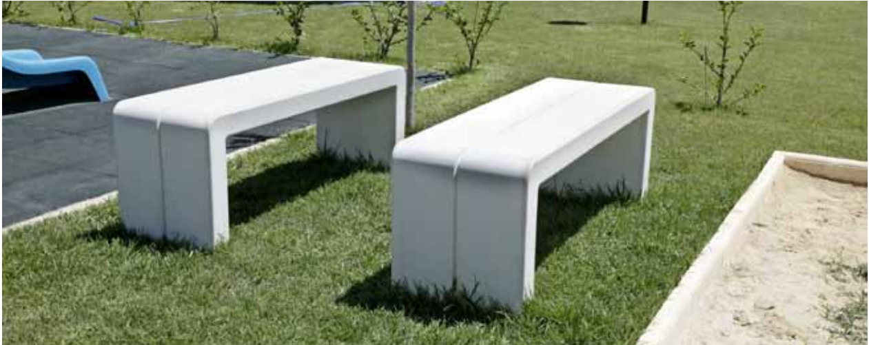
Bancos de hormigón, Delpinox