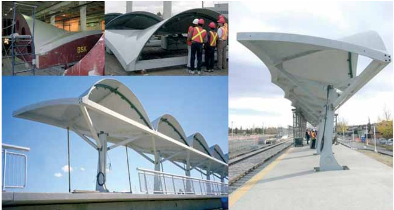
Fotos de la secuencia de moldeado, almacenamiento y puesta en sitio de las bóvedas de Estación de tren en Shawnessy, Canadá, elaboradas con hormigón de polvo reactivo. 7

con áridos especiales, consiguiéndose efectos superplastificantes y produciendo hormigones consistentes muy adaptables. Esta tecnología, que permitió el desarrollo de los hormigones autocompactantes, ha logrado ahora hormigones superdúctiles de menor peso, menos fisuras y un amplio potencial para ser usado, por ejemplo en construcciones contra huracanes. 6