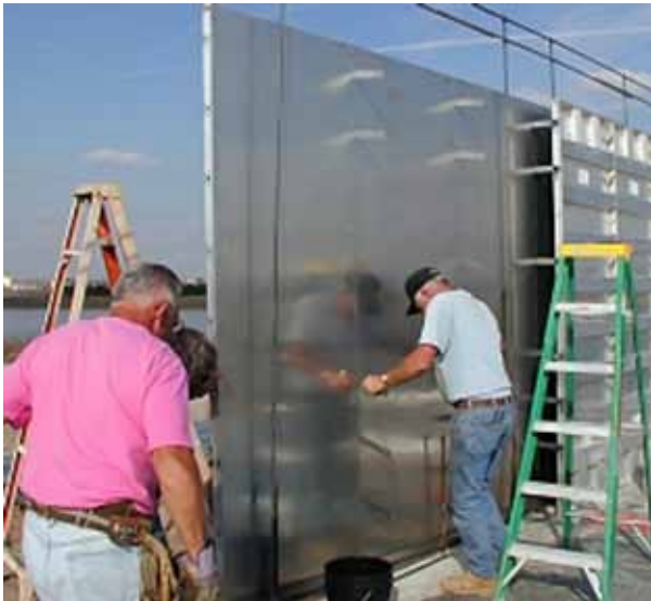
Encofrados de aluminio Precise Forms.