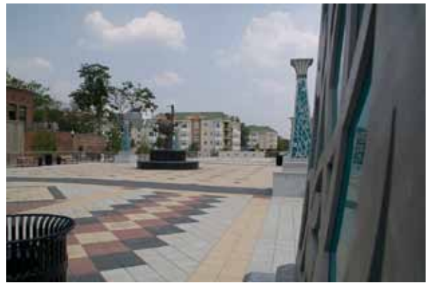
Piso Decatura Marta Plaza, Revista Concrete Internacional, agosto 2008.