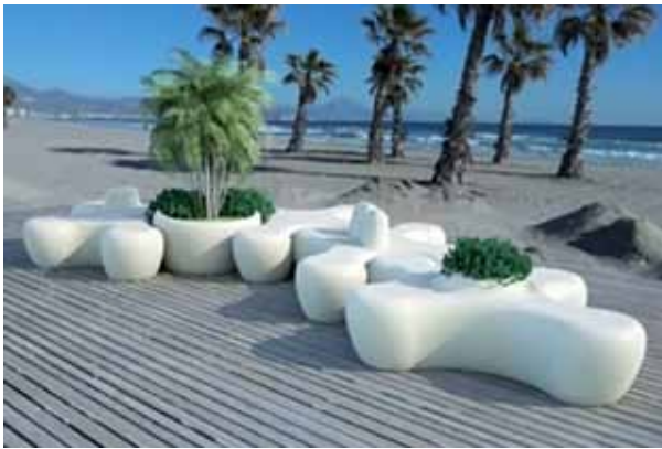
Mobiliario urbano Arq. M. Duart, Colombia