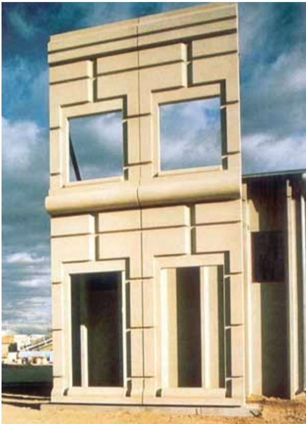
Foto tomada del Architectural Precast Concrete. 1

Las obras realizadas con cemento blanco son tal vez las que primero vienen a la mente cuando se piensa en hormigón arquitectónico. Este cemento permite obtener un amplio espectro de colores desde blancos brillantes, pasteles y saturados, manteniendo las mismas características del hormigón gris. El color del cemento blanco depende de la ausencia de los óxidos de metales, principalmente hierro y manganeso, que son los que originan el color gris en el cemento. También el cemento gris es un gran