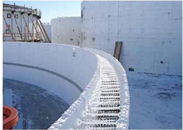
Encofrados de poliestireno expandido de alta densidad Fold-Form.