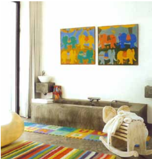
Tina y lavabo de hormigón, Duravit.