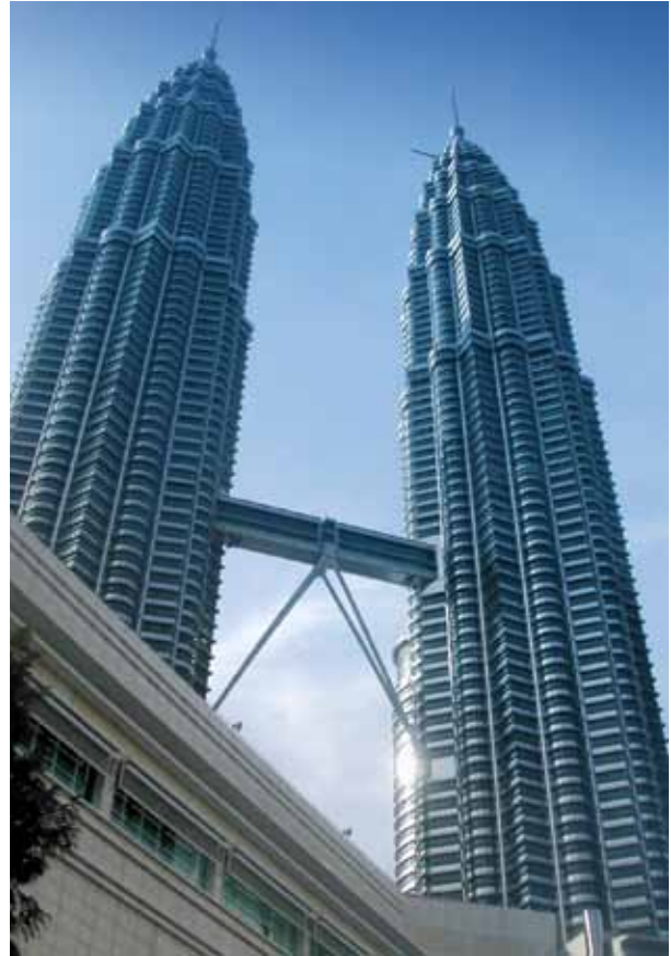
Torres Petronas, Kuala Lumpur, Malasia.