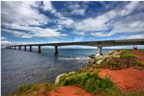
Puente Confederation, Canadá Construido en un medio ambiente severo. Se usaron elementos prefabricados.