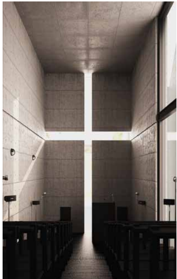
Tadeo Ando, Iglesia de la Luz, Osaka, Japón, foto por Sanghyun Lee.

Otros hormigones son los denominados de alto desempeño, usados desde la década de 1970, que consisten en hormigones con relaciones agua-material cementante inferiores a 0,40 (de 0,25 y 0,30 en el edificio Two Union Square y el puente Confederation de Canadá) que utilizan aditivos superplastificantes y reductores de agua, adiciones (cenizas volantes, humo de sílice, ceniza de cascarilla de arroz, metacaolín) y alcanzan “características mejoradas como una consistencia más alta, módulo de elasticidad más alto, mayor resistencia al esfuerzo a flexión, permeabilidad más baja, mejor resistencia a la abrasión y mayor durabilidad”. 5 Características que compensan los altos costos iniciales de su aplicación. Su resistencia es mayor que 50 MPa., lo que permite secciones más delgadas y usos en edificios elevados con pocas columnas o con columnas de reducidas dimensiones.