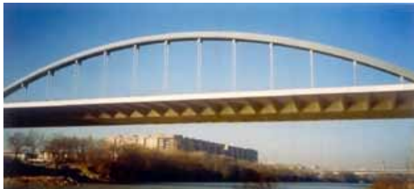
Arco del viaducto sobre el Ebro en la Ronda de la Hispanidad.

El afán de innovar y usar el hormigón en todo su potencial, ha llevado al uso de nuevos materiales o reemplazar los tradicionales, lo que, ha llevado al desarrollo de hormigones especiales creados para desempeños específicos. Un ejemplo es el hormigón autocompactante o autonivelante, cuya resistencia y durabilidad son iguales a las del hormigón convencional, que fluye y se consolida a sí mismo, debido a la inclusión de aditivos superplastificantes. Se diseña utilizando agregados de menor tamaño, mayor cantidad de arena (40-45%), adición de partículas finas menores a 0,125 mm, las que incluyendo el cemento llegan a 450-590 kg/m 3 , cenizas volantes, aditivos superplastificantes y estabilizadores 4 . Entre sus usos están los elementos prefabricados y las estructuras con superficies de acabado arquitectónico con diseños complejos, encofrados estrechos o poco accesibles. Además, se resalta la economía que se logra al reducir mano de obra y eliminar el equipo de vibrado.