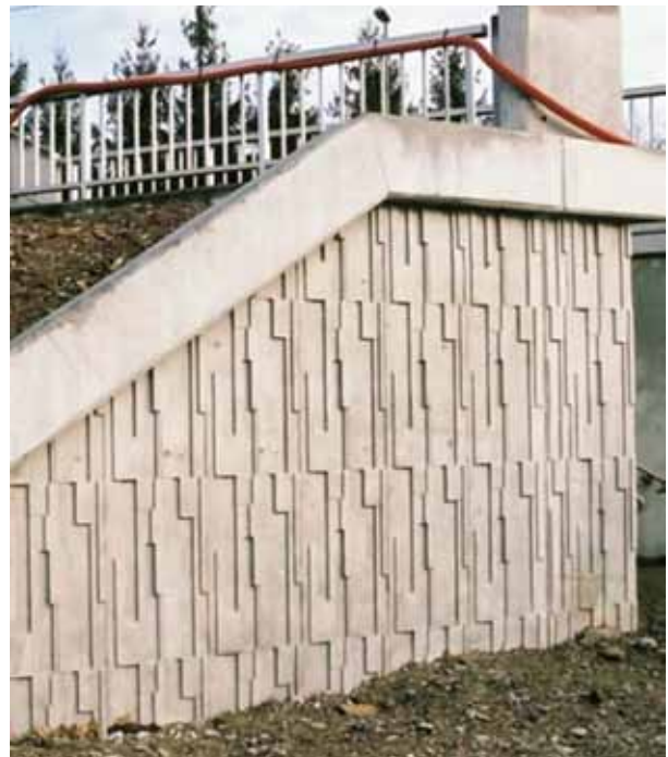
Patrón NawKaw y su aplicación en obra.

El hormigón prefabricado o premoldeado es usualmente elaborado en una planta y transportado a obra, como es el caso de los elementos de mobiliario urbano, adoquines, bloques, balaustres y los trabajos de arte y escultura; en el caso de obras mayores y cuando el espacio lo permite, las piezas se moldean en sitio y se almacenan en él para el izaje e instalación posteriores y contienen los elementos de diseño, vanos, e instalaciones. Este modo de producción se usa cuando el diseño arquitectónico establece igualdad en las partes componentes de una estructura, por la economía que representa el uso repetido de encofrados y moldes.