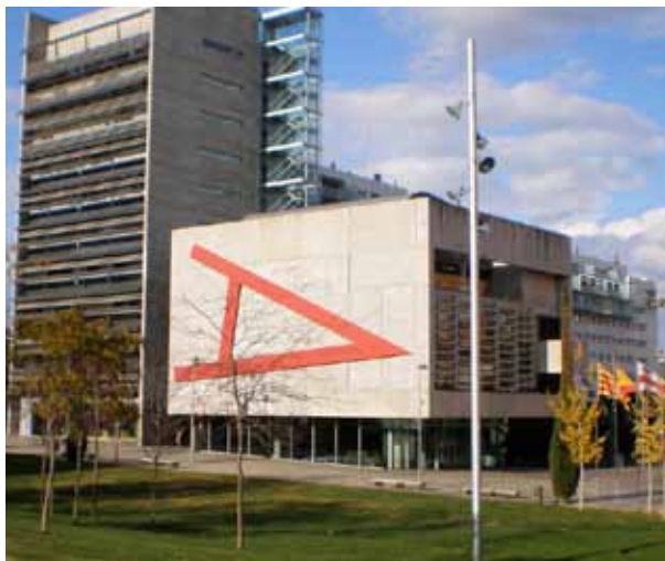
Ayuntamiento de Mollet Valles, Barcelona.

Otros hormigones son los denominados de alto desempeño, usados desde la década de 1970, que consisten en hormigones con relaciones agua-material cementante inferiores a 0,40 (de 0,25 y 0,30 en el edificio Two Union Square y el puente Confederation de Canadá) que utilizan aditivos superplastificantes y reductores de agua, adiciones (cenizas volantes, humo de sílice, ceniza de cascarilla de arroz, metacaolín) y alcanzan “características mejoradas como una consistencia más alta, módulo de elasticidad más alto, mayor resistencia al esfuerzo a flexión, permeabilidad más baja, mejor resistencia a la abrasión y mayor durabilidad”. 5 Características que compensan los altos costos iniciales de su aplicación. Su resistencia es mayor que 50 MPa., lo que permite secciones más delgadas y usos en edificios elevados con pocas columnas o con columnas de reducidas dimensiones.