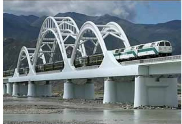
Los pasos laterales del Puente Qinghai-Tibet, fueron realizados con hormigón de polvo reactivo.

La tecnología del hormigón sigue empujando los límites de resistencia de los materiales para satisfacer las demandas actuales, así se han desarrollado los hormigones antes mencionados y hoy se investiga con mayor profundidad en el campo de la nanotecnología, que se basa principalmente en el empleo de partículas de tamaño nano, inferior al micrómetro; ya se usa en adhesivos combinados