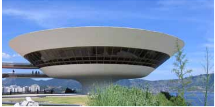
Museo de Arte Contemporáneo Niterói Brasil. Diseño Arq. Oscar Niemeyer.

agregados mediante los procedimientos apropiados como el uso de retardantes superficiales y con las técnicas que existen para el efecto, de las que se puede mencionar el martelinado que realza la naturaleza de los agregados, el sopleteado abrasivo o con arena, el grabado ácido, el esmerilado, entre otros. Para lograr el mejor efecto los agregados deben escogerse por su forma y color. Los patrones pueden ser de madera, plástico, elastómero o poliestireno expandido, dependiendo de su costo, número de usos y facilidad de empleo. Al texturizar una superficie de hormigón se logra mayor uniformidad que con superficies lisas, se enriquece el diseño e incluso se pueden encubrir diferencias o irregularidades menores que pueda tener el hormigón.