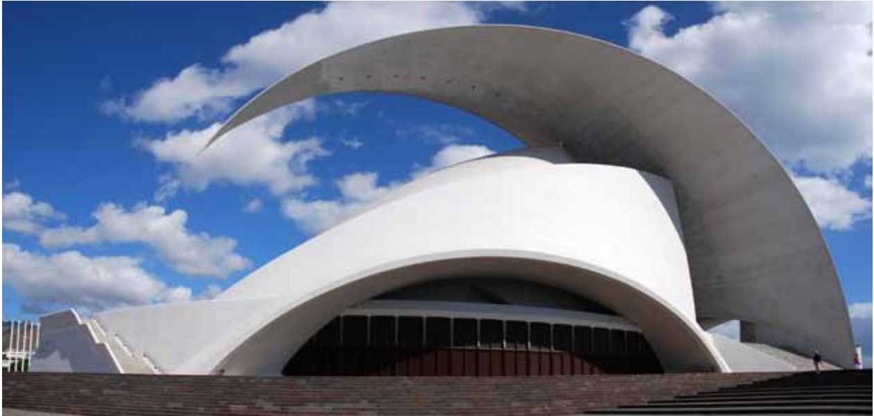
Auditorio de Tenerife, España, Santiago Calatrava. 3