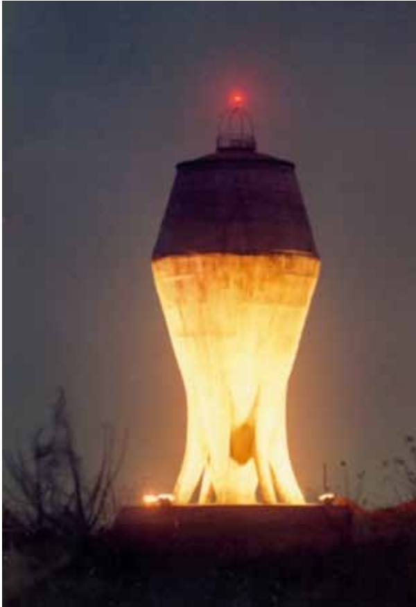
Tanque de almacenamiento de agua, ESPOL, Guayaquil.